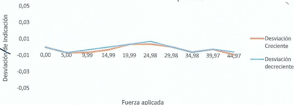
Desviaciones Vs Fuerza aplicada